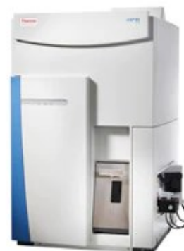
รูปที่ 1 เครื่อง iCAP RQ ICP-MS Thermo Scientific