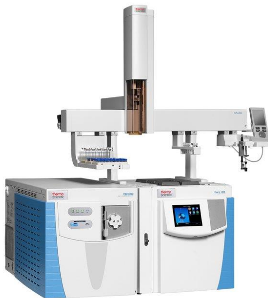
รูปที่ 1 Thermo Scientific TSQ 9000 GC-MS/MS